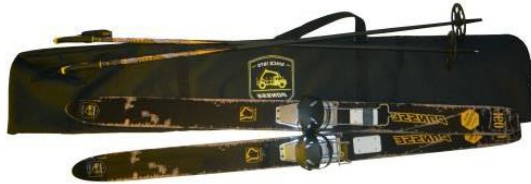
SKI-SET P-880 (retro)